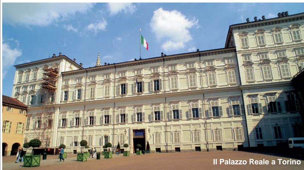
Il Palazzo Reale a Torino