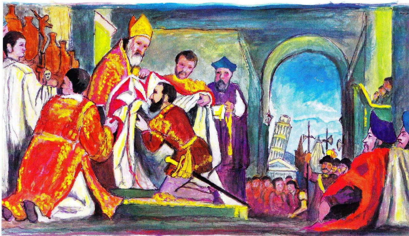
Ricostruzione della tavola del Cigoli sull'investitura di Cosimo de' Medici a Gran Maestro dell'Ordine di S. Stefano