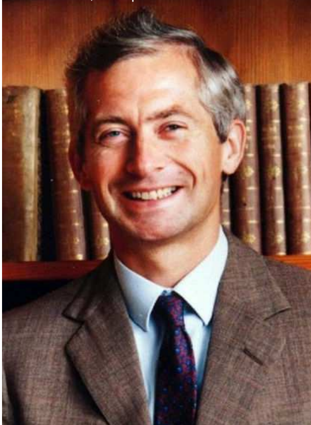
Hans-Adam II, Principe Sovrano del Liechtenstein

Entro tale spazio si applicano regole e procedure comuni in materia di visti, soggiorni brevi, richieste d'asilo e controlli alle frontiere. Contestualmente, per garantire la sicurezza all'interno dello spazio di Schengen, è stata potenziata la cooperazione e il coordinamento tra i servizi di polizia e le autorità giudiziarie. La cooperazione Schengen è stata inserita nel quadro legislativo dell'Unione europea attraverso il trattato di Amsterdam del 1997. Tuttavia, non tutti i partecipanti alla cooperazione Schengen sono membri dello spazio Schengen, perché non desiderano abolire i controlli alle frontiere oppure perché non soddisfano i requisiti richiesti per l'applicazione di Schengen.