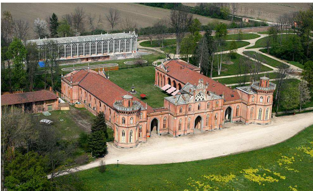
Castello di Racconigi

L'archivio, che sarà messo quanto prima in consultazione, sarà oggetto di una iniziativa di valorizzazione e di studio, nell'ambito delle celebrazioni dei 150 anni della proclamazione del Regno d'Italia e della mostra La macchina dello Stato, Leggi, uomini e strutture che hanno fatto l'Italia , che sarà inaugurata il 20 settembre 2011.