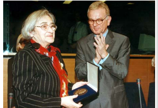
Elena Bonner riceve la medaglia Robert Schuman nella sede di Strasburgo del Parlamento Europeo il 3 aprile 2001