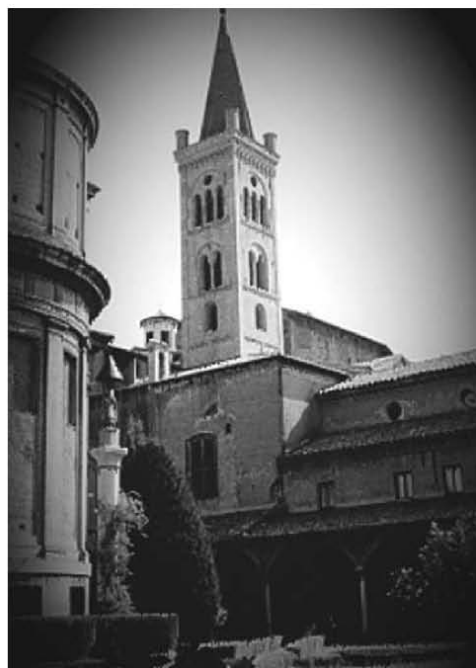
Bologna, chiostro della basilica di San Domenico