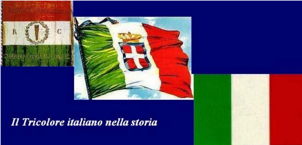
Il Tricolore italiano nella storia

Con la festa della bandiera a Reggio Emilia, e poi a Forlì e Ravenna, partono le celebrazioni istituzionali del 150° della proclamazione del Regno d'Italia