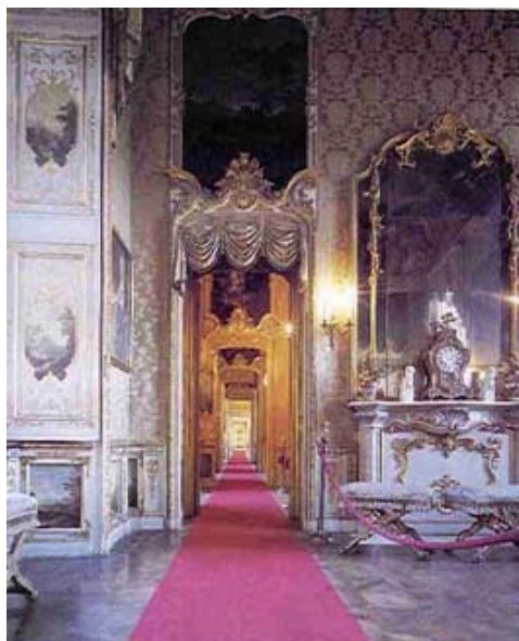
Particolare del Primo Piano Nobile

Costo ingresso a Palazzo Reale: € 6,50 (gratuito sotto i 18 anni e sopra i 65, e per i possessori di Abbonamento Musei 2005).