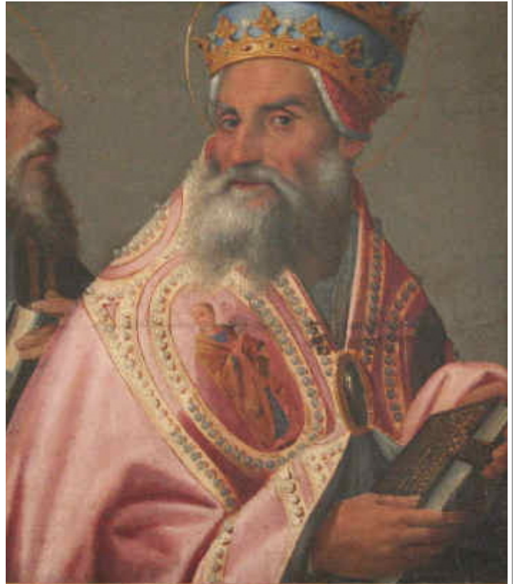
S.S. Gregorio XIII

Egli governò con indipendenza e curando personalmente tutti gli affari importanti. Predisposto alla laboriosità e largo d'udienze, ma sintetico nei colloqui e rapido nelle decisioni, si circondò di Gesuiti, Cappuccini, Teatini; fu ben influenzato da S. Carlo Borromeo e S. Filippo Neri, che molto lo coadiuvarono specialmente nel Giubileo del 1575 durante il quale approvò la Congregazione dell'Oratorio. In particolare beneficò i Gesuiti, favorendo gli studi ecclesiastici, consapevole che la Riforma non poteva essere attuata se non attraverso un clero colto e ben preparato; fece costruire dall'Ammannati