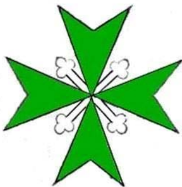
L'insegna dell'Ordine nel 1572