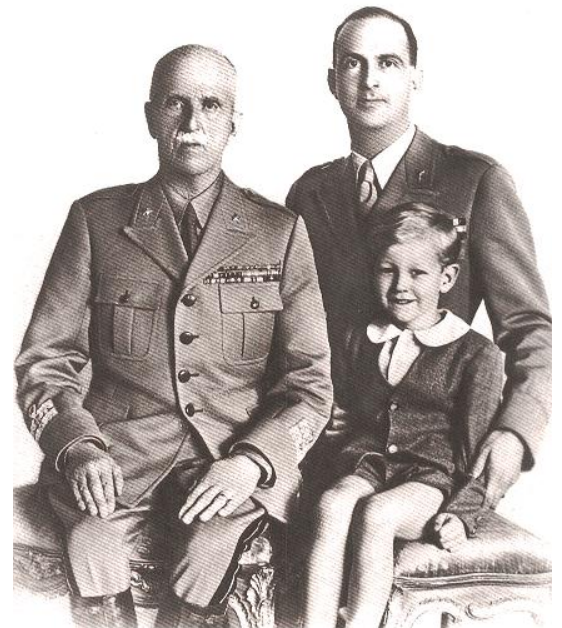
Re Vittorio Emanuele III, Re Umberto II e l'attuale Capo di Casa Savoia, il Principe Vittorio Emanuele