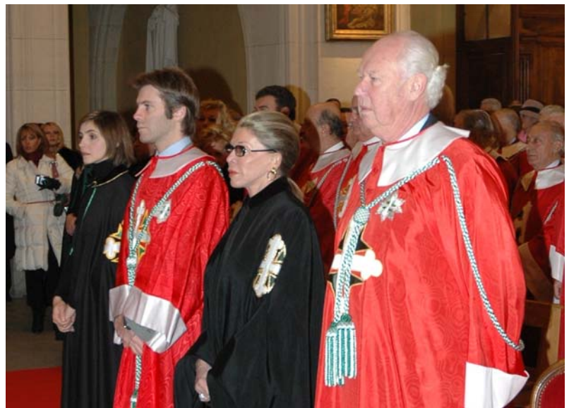
La Famiglia Reale a sinistra in un'occasione ufficiale sopra al XXI Capitolo Generale degli Ordini Dinastici di Casa Savoia