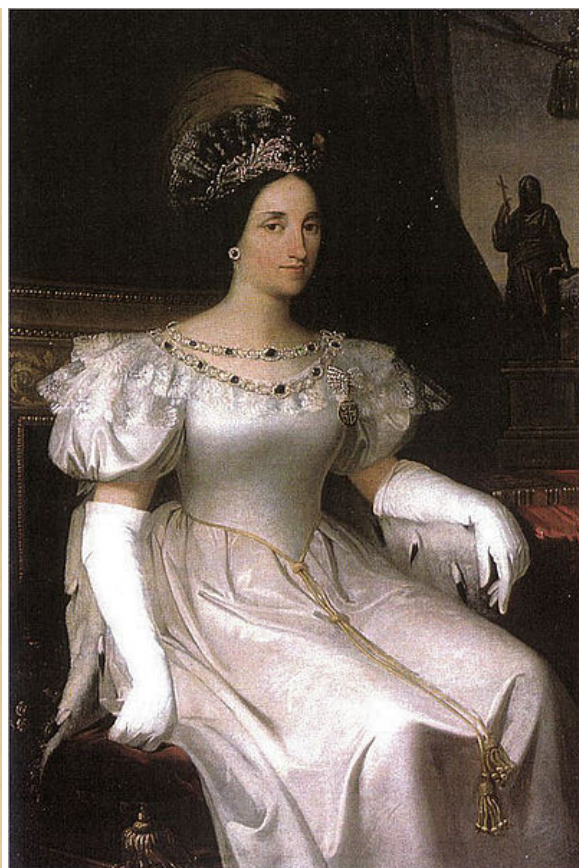
Maria Beatrice di Savoia

Figlia del Re di Sardegna Vittorio Emanuele I Consorte del Duca di Modena Francesco IV Madre del Duca di Modena Francesco V