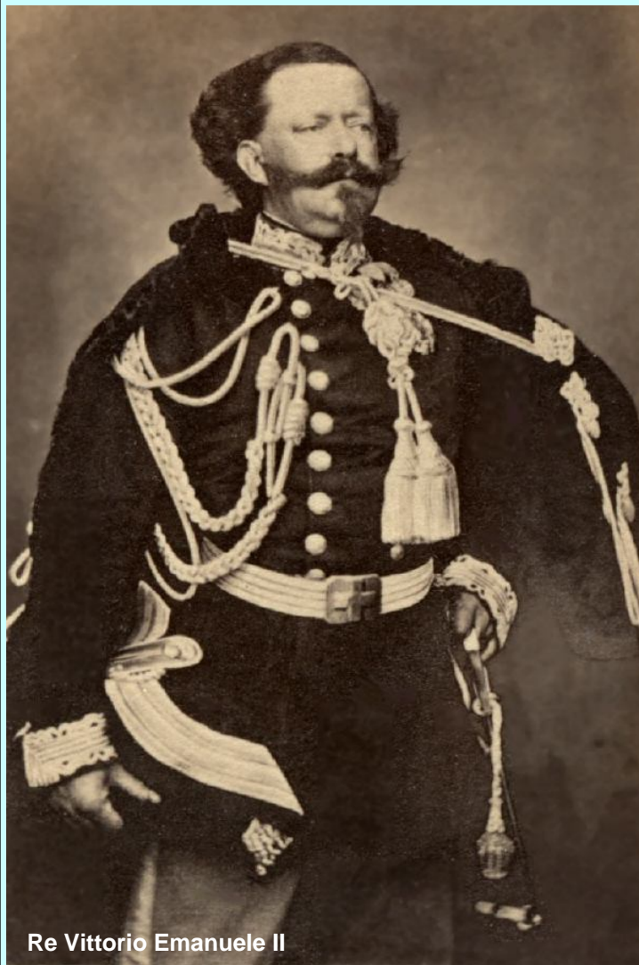
Re Vittorio Emanuele II

Dal 1898 al 1942, il Regno d'Italia decretò riconoscimenti collettivi per le azioni altamente patriottiche compiute dalle città italiane nel periodo del Risorgimento nazionale (1848 - 1918), assegnando 27 Me-