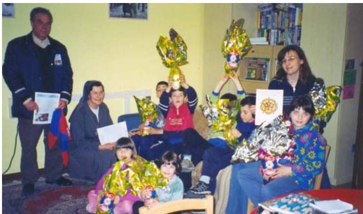
Dono delle uova a Villa Russiz, Capriva del Friuli (GO)