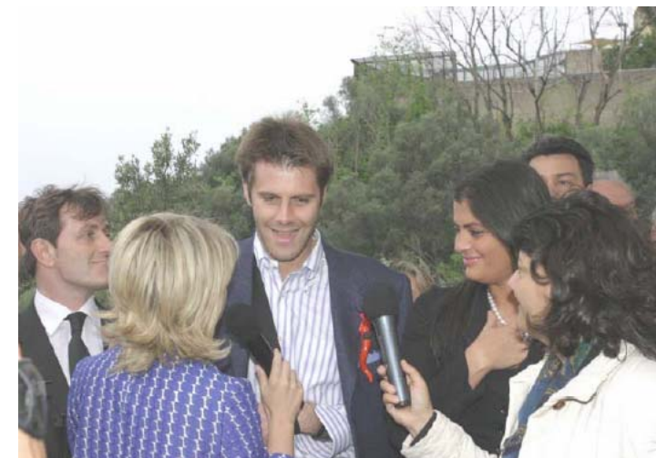
La visita del Principe Ereditario ha suscitato vivo interesse negli organi d'informazione, sia locali sia nazionali

Si è commosso anche lui! Sì, S.A.R. il Principe Emanuele Filiberto di Savoia, il 29 aprile 2004 alle ore 14, in visita, ha incontrato per la prima volta i ragazzi di Nisida. Un incontro fatto di sguardi, sorrisi, emozioni e tanta commozione. Il Principe ha accettato l'invito dell'IRCS e dei Lions del Distretto 108 Ya, con il patrocinio della Fondazione Principe di Venezia, di presiedere una serata di gala all'Accademia Aeronautica di Pozzuoli dove oltre 600 sono intervenuti per raccogliere i fondi necessari al sovvenzionamento del laboratorio musicale di Nisida per un anno. E' stato questo un tipo di beneficenza diverso che al Principe è piaciuto molto, proprio perché non si è trattato di pura e semplice carità