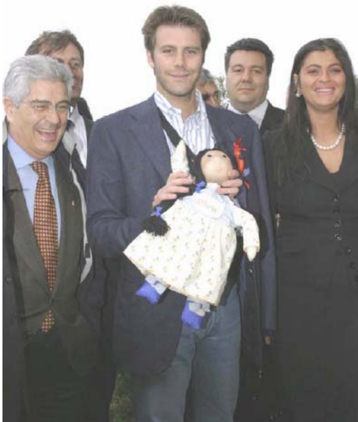
A Nisida, con la bambola di pezza confezionata per S.A.R. la Principessa Vittoria dalle ragazze ospiti dell'Istituto