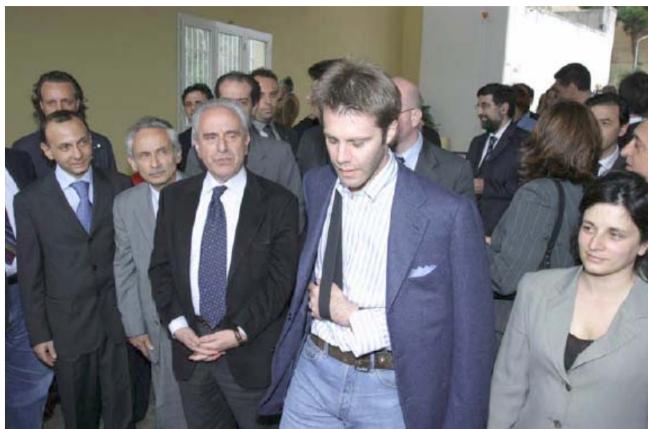
Il Principe Ereditario in visita all'Istituto Penale Minorile di Nisida

Chi ama i giovani e crede in loro non può e non deve tirarsi indietro, fingendo di non sapere che esistono e soffrono. Noi continueremo a mettercela tutta e abbiamo anche capito, come l'ha capito il Principe, perché i ragazzi di Nisida tengono tanto al laboratorio musicale. Con l'arte, con la musica e il canto si favorisce uno scambio tra il dentro e il fuori dell'Istituto Penale, il dentro e il fuori di ogni giovane e le emozioni so-