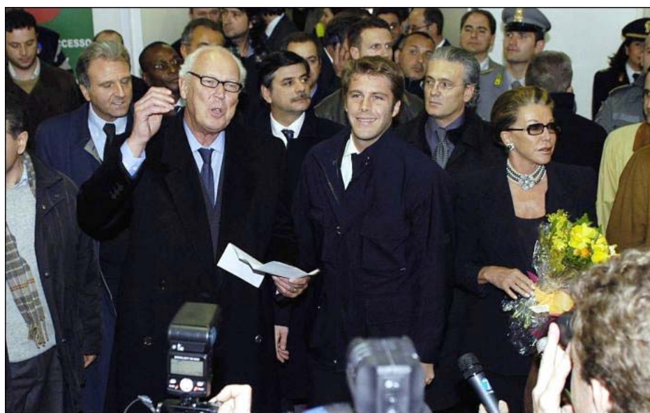
La Famiglia Reale al suo rientro a Napoli.

Una delegazione ha partecipato alla commemorazione di Don Giuseppe Diana,