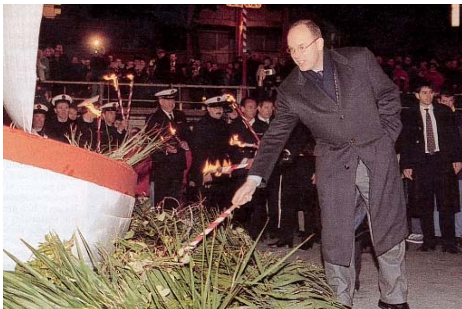
S.A.S. il Principe Ereditario Alberto di Monaco mentre dà fuoco al gozzo