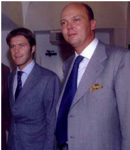
S.A.R. il Principe di Piemonte e di Venezia Emanuele Filiberto di Savoia con S.A.R. il Principe Sergio di Jugoslavia

Nella terza ed ultima tappa è benedetta la Cattedrale, simbolo religioso. Come ogni anno, il rito commemorativo è stato commovente e suggestivo, anche se è stata particolarmente sentita l'assenza di S.A.S. il Principe Ranieri III, a cui tutti i monegaschi, e i nostri Confratelli in particolare, hanno rivolto un augurio di pronta guarigione.