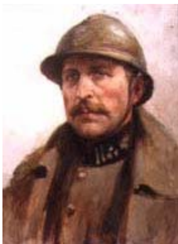
Alberto I Re dei Belgi

Messa e all'inaugurazione del "Monumento ai caduti e agli invalidi del lavoro", alla presenza del Sindaco Roberto Zambolin.