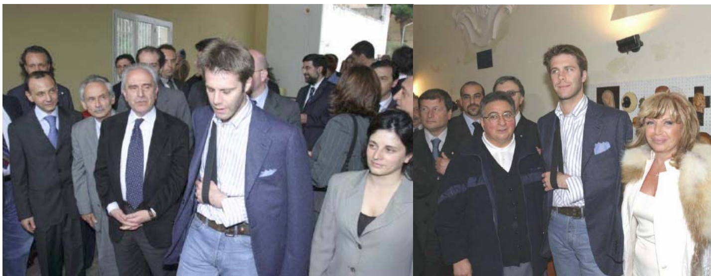
A sinistra: il Principe di Piemonte e di Venezia in visita all'Istituto Penale Minorile di Nisida A destra: in visita al dormitorio pubblico "Vittorio Emanuele II"