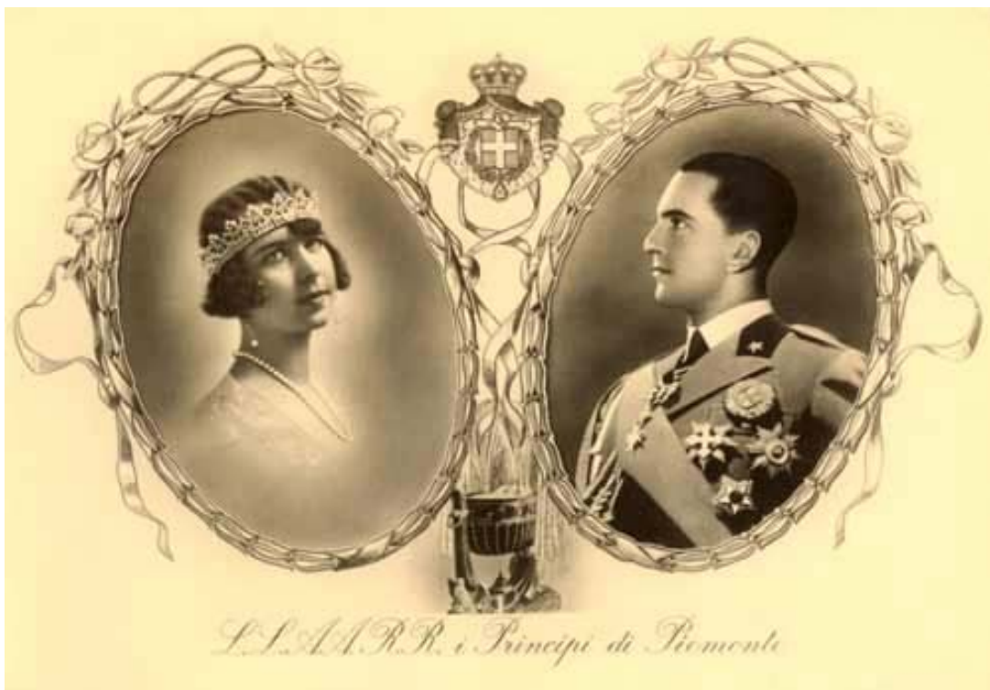
Cartolina nuziale degli allora Principi di Piemonte, Umberto e Maria José