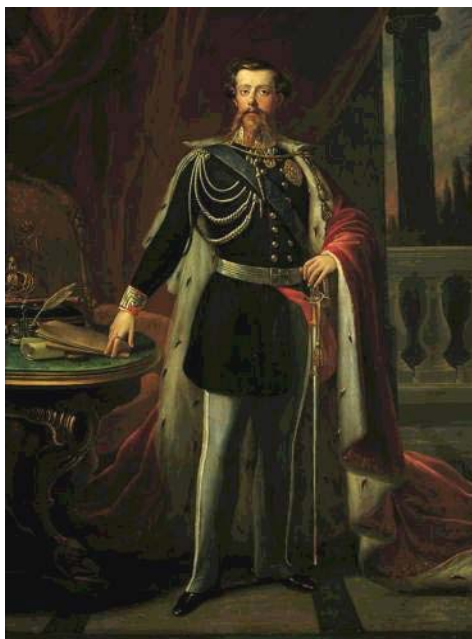
Re Vittorio Emanuele II

Una delegazione ha partecipato, nella Pontificia Parrocchia di Sant'Anna, alla solenne concelebrazione presieduta da S.Em.R. il Signor Cardinale José Saraiva Martins,