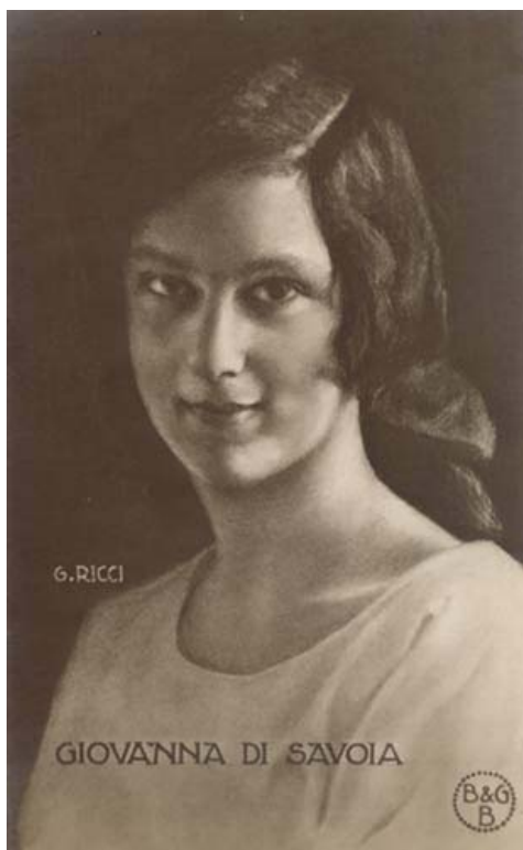
Giovanna di Savoia Regina Madre dei Bulgari in un ritratto giovanile

genetliaco, tre mesi dopo la sua trionfale visita per il cinquantenario della morte (non ancora spiegata) del Consorte, lo Zar Boris III.