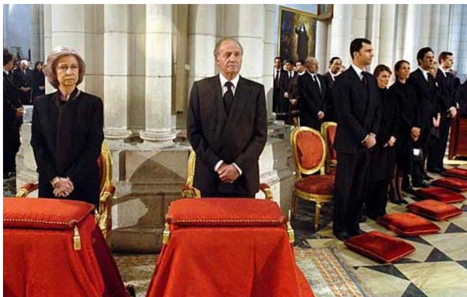
Re Juan Carlos I e la Regina Sofia di Spagna durante la cerimonia funebre nella Cattedrale dell'Almudena

Una delegazione ha partecipato, presso la Sala degli Stucchi di Palazzo Trisino, alla