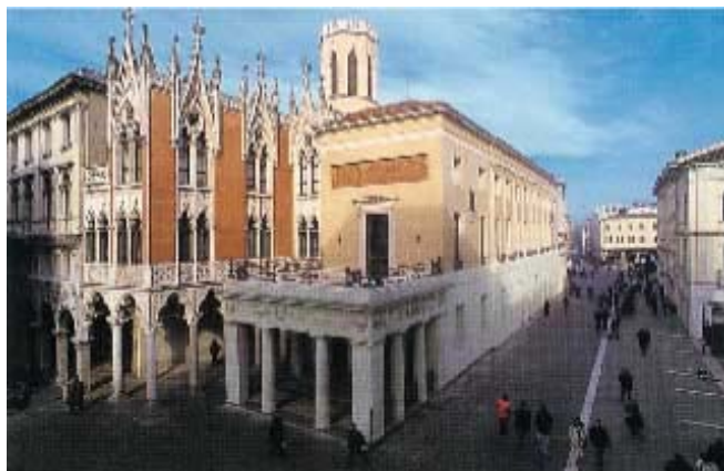
Lo stabilimento Pedrocchi a Padova

Una delegazione ha partecipato alla Santa