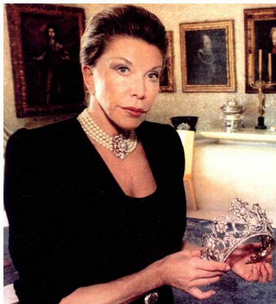
S.A.R. La Principessa Reale Marina

Una delegazione ha partecipato, al Teatro