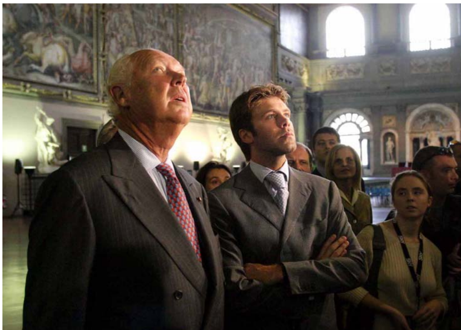
Il Capo di Casa Savoia in visita a Firenze con il Principe Ereditario

Questa splendida e intelligente realizzazione, che raccoglie 150 anni di Storia nazionale e locale, dalla fine della Serenissima fino al cambiamento istituzionale, ha avuto un comitato scientifico che ha lavorato per