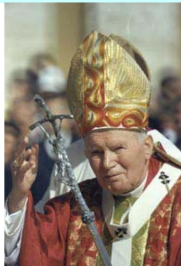
S.S. Giovanni Paolo II benedice i giovani durante la GMG del 1981 a Buenos Aires

Oggi meno che mai ci si può arrestare ad una fede cristiana superficiale o di tipo sociologico; i tempi, voi ben lo sapete, sono cambiati. L'aumento della cultura, l'influenza continua dei "mass media", la conoscenza delle vicende umane passate e presenti, l'aumento della sensibilità e dell'esigenza di certezza e di chiarezza sulle verità