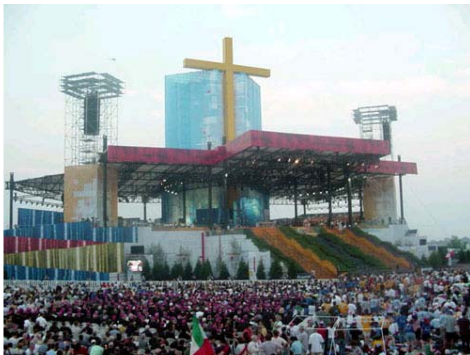
Toronto, GMG 2002: il palco per la Santa Messa finale

E' necessario all'uomo questo sguardo amorevole: è a lui necessaria la consapevolezza di essere amato, di essere amato eternamente e scelto dall'eternità (cfr. Ef 1,4). Al tempo stesso, questo eterno amore di elezione divina accompagna l'uomo durante la vita come lo sguardo d'amore di Cristo. E forse massimamente nel momento della prova, dell'umiliazione, della persecuzione, della sconfitta, allorché la nostra umanità viene quasi cancellata agli occhi degli uomini, oltraggiata e calpesta: allora la consapevolezza che il Padre ci ha da sempre amati nel suo Figlio, che il Cristo ama ognuno e sempre, diventa un fermo punto di sostegno per tutta la nostra esistenza umana. Quando tutto si pronun-