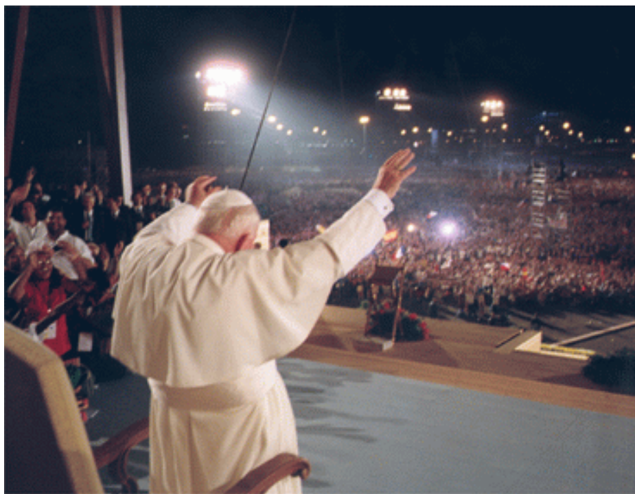
Il Santo Padre a Czestochowa, per la Giornata Mondiale della Gioventù, nel 1991

Permettete, perciò, che in linea di massima io colleghi la mia riflessione nella presente lettera con questo incontro e con questo testo evangelico. Forse in tal modo sarà più facile per voi sviluppare il pro-