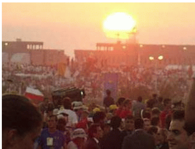
Denver, GMG 1993: i giovani radunati per la Veglia

Io ripeto queste parole della Madre di Dio e le rivolgo a voi, giovani, a ciascuno e a ciascuna: «Fate quello che Cristo vi dirà».